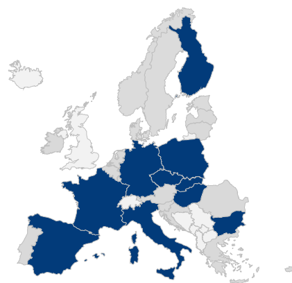
Fig. 2: riscontri ricevuti dai richiedenti ASAP